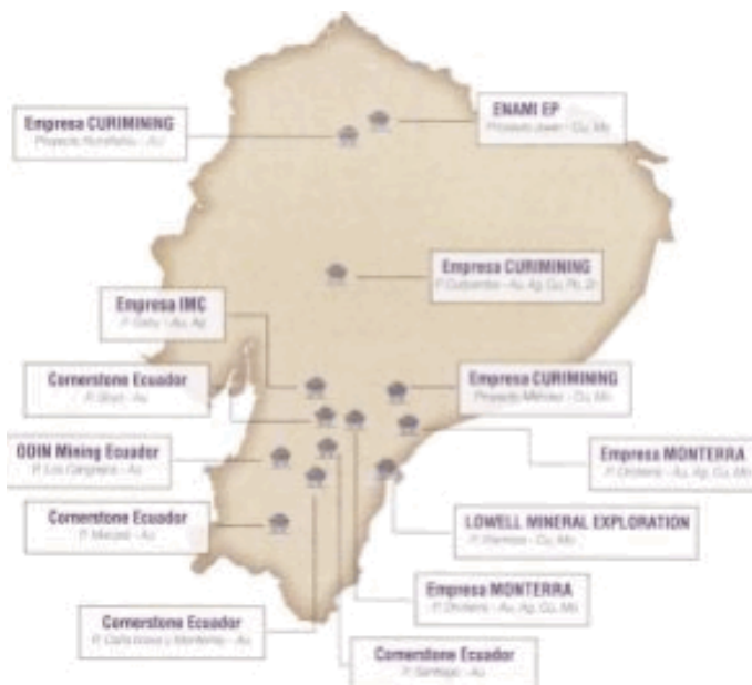
Figura 4. Proyectos de Exploración.

Como establece la Constitución y la Ley de Minería, el desarrollo de los proyectos debe ser con respeto al ambiente, a las comunidades; es decir, estar armonizado con una gestión socio ambiental adecuada que garantice el respeto de los derechos sociales, ambientales, y por otro viabilice la efectiva y sostenida operación de los emprendimientos mineros. Es la única manera mediante la cual la minería seguirá siendo una fuente de desarrollo para el país, en general, y las comunidades, en particular.