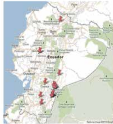
Figura 3. Conflictos Sociales. Fuente: EL COMERCIO" (2012)

En un artículo del Diario "EL COMERCIO" (2012) afirma: "La minería a gran escala se ha convertido en una creciente causa de conflictos sociales y ambientales. La minería en cierto aspecto es rechazada por los habitantes de la población o el lugar donde hay estos minerales importantes para la actividad económica.