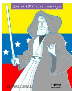
Figura 2 Caricatura del maestro Jedi Obi-Wan Kenobi personaje de la película "La guerra de las galaxias", codificación C2 en esta investigación. Fuente: (Sanabria, 2017, 9 de octubre).

La caricatura desde el plano icónico representa un personaje popular humorístico venezolano apodado "El chuniór". En el plano verbal se presenta una oración asertiva y una exclamativa.