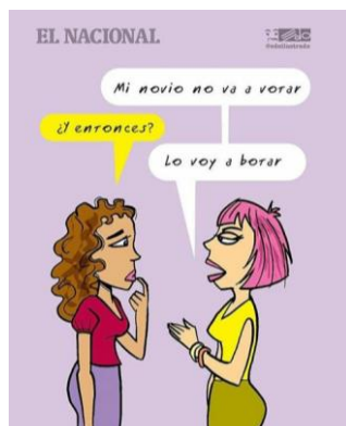
Figura 4 Caricatura de un par de mujeres conversando, codificación C4 en esta investigación.

En la C3 se repite la estructura narrativa única. Nuevamente el personaje es el llamado “Chuniór”. El plano verbal se encuentra caracterizado por oraciones exhortativas y desiderativas.