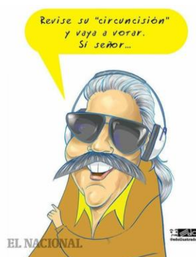
Figura 1 Caricatura del personaje "El Chuniór", locutor venezolano, codificación C1 en esta investigación. Fuente: (Sanabria, 2017, 8 de octubre).

Para poder realizar el análisis se recopilamos una serie de caricaturas seleccionadas intencionalmente en atención a conformar el corpus de Eduardo Sanabria en lo referente a la convocatoria a participar en las elecciones regionales del 2017 en Venezuela.