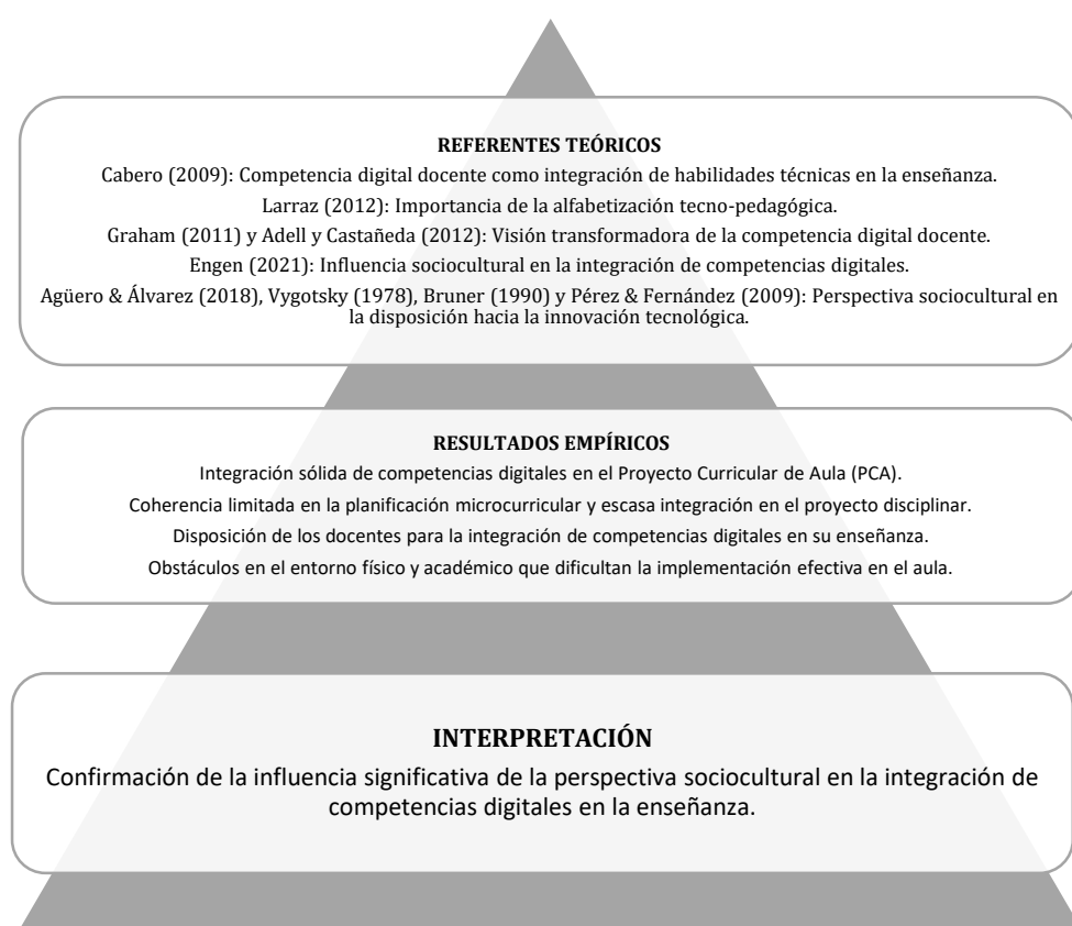
Figura 3. Triángulo de resultados -Referentes teóricos-Resultados empíricos-Interpretación