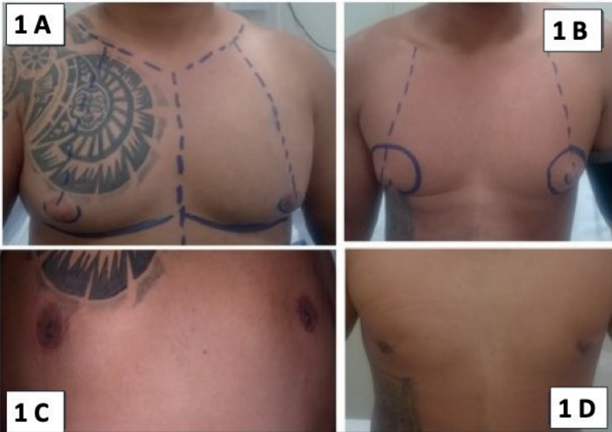
Figura 1. 1A y 1B pacientes prequirúrgicos con ginecomastia. 1C y 1D pacientes posquirúrgicos con exéresis abierta infra alveolar.

porte de imagenología en el 100% de los pacientes reportó hiperplasia de la glándula mamaria compatible con ginecomastia.