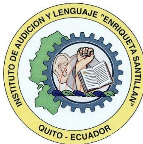
Figura 1. Escudo del Instituto Fiscal de Audición y Lenguaje Enriqueta Santillán