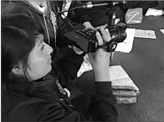
Figura 3. Participantes del taller audiovisual en las grabaciones para el producto final.