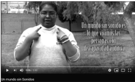
Figura 4. Fotograma del video Un mundo sin sonidos .

En los comentarios de los participantes podemos apreciar la principal necesidad que tienen de comunicarse con las personas oyentes de su entorno. Al fallar esta interacción, se producen pensamientos negativos respecto de su condición de discapacidad. De igual manera, se producen sentimientos de soledad y exclusión al ser ignorados. Los talleres cumplieron la función de crear una alternativa comunicativa entre las personas con discapacidad auditiva con la sociedad oyente. Al ser una herramienta amigable para ellos, sintieron seguridad y confort al realizar el producto audiovisual final.