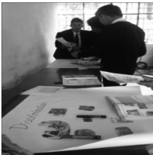
Figura 2. Participación de los estudiantes en la cartografía social

Los estudiantes utilizaron recortes y gráficos para plasmar sus ideas, los pegaron en una cartulina grande y los etiquetaron con marcador. Después de culminar la tarea, cada grupo de trabajo expuso el contenido de esta, lo que signifi-