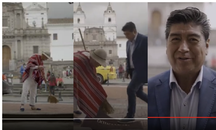
Imagen 2. Escenificación de Yunda y Cantuña

La comedia se puede identificar en la puesta en escena de sus videos, como se observa en el siguiente ejemplo donde Yunda llama la atención al personaje Cantuña por tratar de ocultar la basura mientras limpia. También se combina la realidad con la ficción y el uso de la identidad local en la campaña.