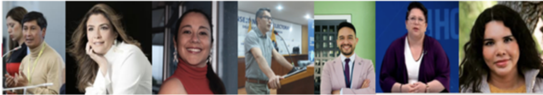
Imagen 1 Actores políticos seleccionados