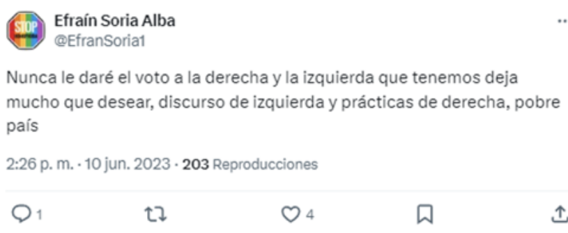
Imagen 4 Posicionamiento político de actores históricamente excluidos

En el análisis se observan rasgos del proceso de politización de los sujetos, no todo el proceso. Dicho proceso es de naturaleza mucho más larga. No ocurre en un mes, sino a lo largo de la vida. Así, las conductas observadas por parte de los actores no serían específicas de este mes (junio 2023), aunque su presencia sea más visible debido a los sucesos políticos que agudizaron su politización.