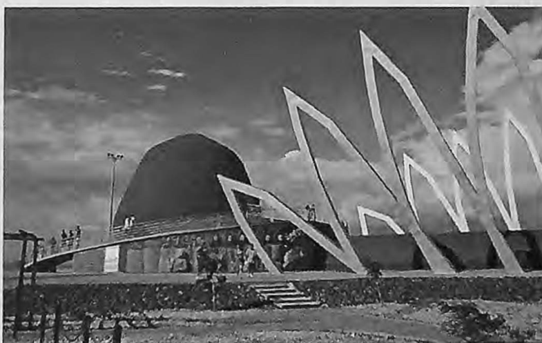
Montecristi, imagen tomada de http://mantaecuador.com.ec/

No obstante, al propio tiempo que ocurría aquello, esa percepción novedosa para interpretar lo que es la sociedad de ahora, olvidó que los desajustes económicos –y por lo tanto los sociales- del Ecuador de fines del siglo XX no solo tuvieron como responsables a quienes se les denomina como parte de la “partidocracia”, sino que las responsabilidades mayores estuvieron en manos de los sectores financieros y de la banca privada tanto local como extranjera. Estos sectores han manipulado la situación nacional y que habiendo cometido el más grave asalto al erario nacional han quedado olvidados en cuanto a lograr que respondieran por sus actos que condenaron al país a una situación dramática.