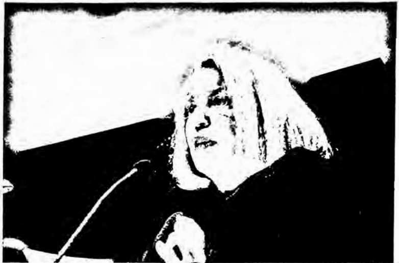
Nancy Fraser

la reflexividad, la de-construcción y la re-construcción del discurso y de las prácticas. 75