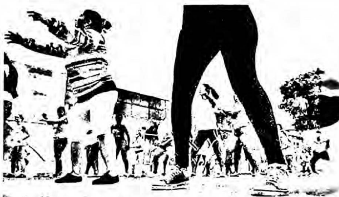
Mujeres PPL en clases de balloterapia en CRS de Guayaquil.

El recorrido por los escenarios de estas mujeres, los talleres, la cocina y la capilla nos acercan al ámbito femenino. ¿En realidad su estadía y actividad las prepara para los escenarios fuera de la cárcel?: