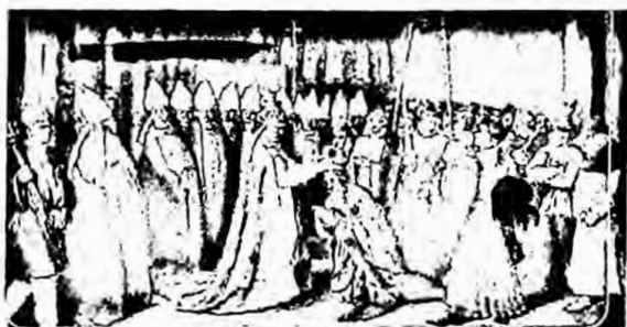
...creencia en que el poder de la autoridad que gobierna proviene de una autoridad de carácter divino superior...

Con esta transpolarización se justificó que la razón y el poder eran develados por Dios y entregado a una persona humana elegida y su ejercicio del poder en esas condiciones, sólo podía ser virtuoso y legítimo.