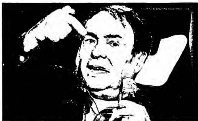
Pierre Bourdieu.

La reproducción de las desigualdades sociales, a través del sistema educativo capitalista (Castillo, 2009), ha sido y continuará siendo uno de los temas que menos interés ha atraído por parte de los científicos sociales, nos dice Bourdieu. En la mayoría de casos, es un fenómeno desapercibido, que forma parte de una visión "normal" del mundo social, pues las clases privilegiadas han utilizado el sistema educativo como un instrumento eficaz para mantener, asegurar y perpetuar las estructuras de dominación capitalista.