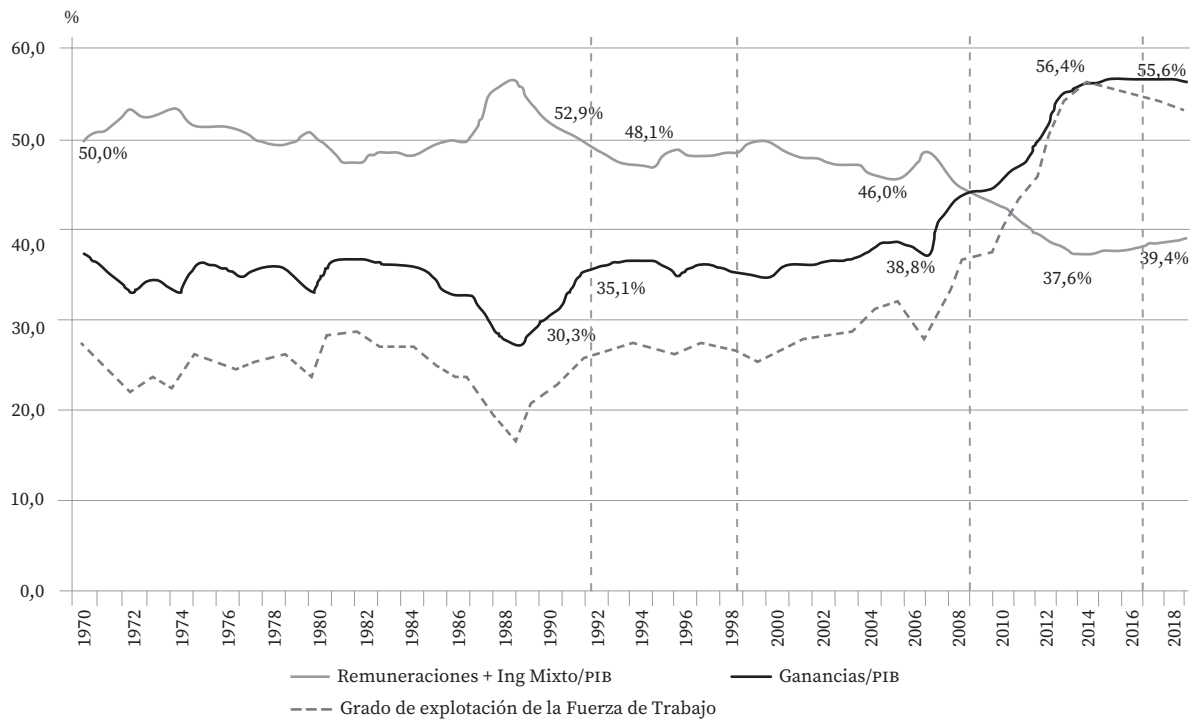
Figura 2. Panamá: participación de las remuneraciones y las ganancias en el PIB y grado de explotación de la fuerza de trabajo (1970-2019)

Fuente: Elaboración propia con base en datos del Instituto Nacional de Estadística y Censo, Panamá.