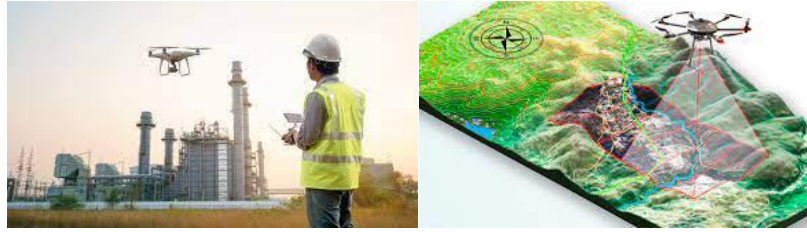
FIGURA 5 Usos drones

La Organización de Aviación Civil Internacional (OACI), o ICAO en su versión inglesa, ha desarrollado un Plan Mundial de Navegación Aérea hasta el 2030. A partir de este ambicioso proyecto, las entidades que regulan la aviación civil que hacen parte de los países vinculados, se encuentran comprometidos con cumplir estas metas, incluidas la de integrar el uso de Drones o UAS al sistema aeronáutico. La autoridad aeronáutica de cada país tiene diversas maneras de integrar estas normativas.