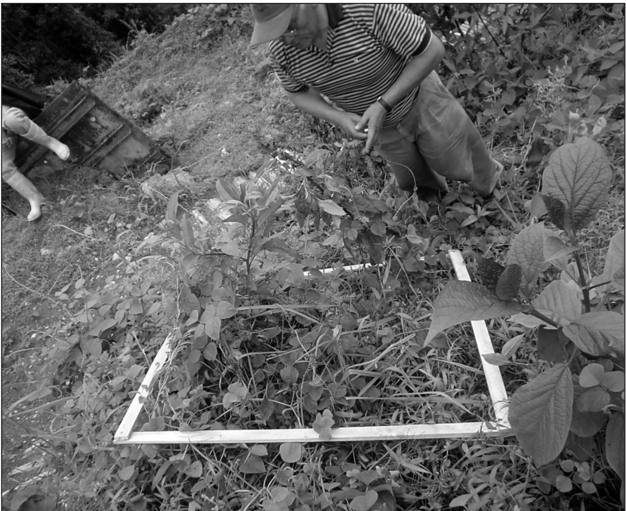
Figura 2. Área Mínima, conteo e identificación.

En una segunda visita se realizó el conteo de las especies herbáceas dentro del Derecho de Vía, utilizando el método del Área Mínima (Barbour, Burk & Pitts, 1973) a fin de hacer el análisis cuantitativo de la flora que se ha restablecido después de la perturbación producida, incluyendo las tres especies sembradas Phaseolus polyanthus (gualea), Paspalum sp. (nudillo) y Panicum polygunatum (cola de conejo), por recomendación de la Fundación Jatun Sacha (Figura 2).