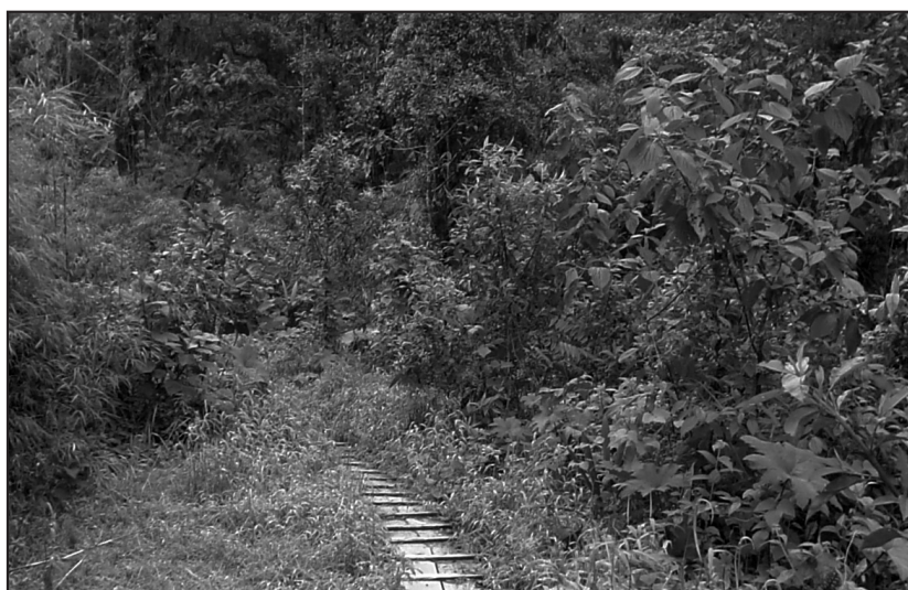
Figura 5. Respuesta de la vegetación, después de la perturbación.

A pesar de que existió un gran impacto negativo para la flora y la fauna, después de tres meses de haber concluido la obra de ingeniería se observó que la vegetación se ha restablecido con gran vigor, porque el número de especies herbáceas encontradas en los espacios abiertos es mayor que las encontradas en el interior del bosque (Figuras 4 y 5).