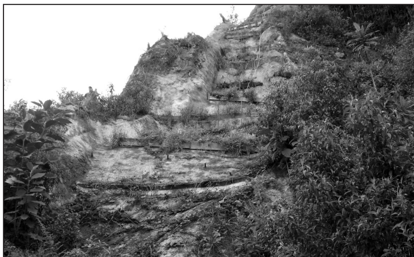
Figura 4. Fase de mantenimiento del oleoducto.

En el conteo de las especies herbáceas dentro del DDV, se observó que la flora en el sitio perturbado se había restablecido. Entre las especies de plantas encontradas se incluyen las tres especies sembradas Phaseolus polyanthus (gualea), Paspalum sp. (nudillo) y Panicum polygynatum (cola de conejo). Las especies que se encuentran con más frecuencia son aquellas que corresponden a la familia de las Asteraceae, seguido de las Poaceae y luego las pteridofitas, representadas por los helechos.