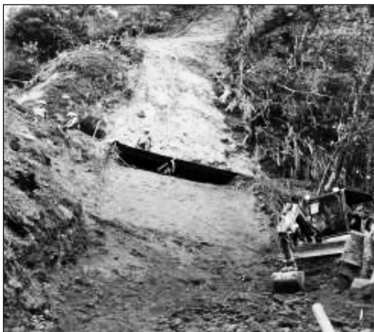
Figura 1. Obra de ingeniería en fase de construcción.

En este lugar se realizaron obras de ingeniería a fin de colocar la tubería del Oleoducto de Crudos Pesados (OCP), ejecutar aseguramientos y sostenimiento de la misma, Esta actividad antrópica provocó un gran impacto en el ecosistema, específicamente en la flora y la fauna del lugar (Figura 1).