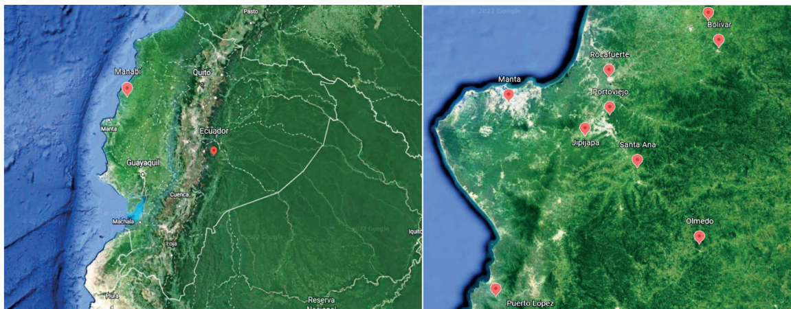
Figura 1. Ubicación geográfica de los cantones del centro-sur de la provincia de Manabí, Ecuador (Google Earth, 2022). Figure 1. Geographical location of the south-central cantons of the province of Manabí, Ecuador (Google Earth, 2022).