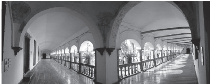
Galería superior del claustro principal.

Finalmente, la colaboración del antiguo Ministerio Coordinador de Patrimonio, los Ministerios de Cultura y Patrimonio y Turismo, la Arquidiócesis Metropolitana de Quito, de la Embajada de los Estados Unidos Mexicanos, de instituciones religiosas del Centro Histórico, de la Universidad Tecnológica Equinoccial (con quien se suscribió un importante convenio de colaboración técnica), de diversas organizaciones no gubernamentales y de la sociedad civil organizada que apoyaron el proceso, cada uno desde su ámbito de acción.