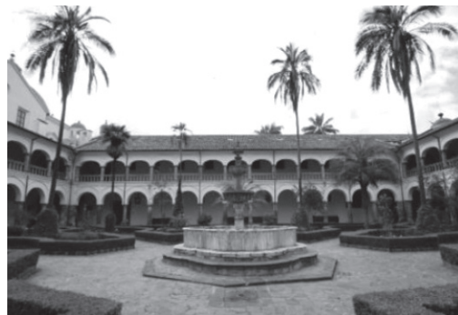
Claustro principal de San Francisco.

“San Francisco es aún hoy en día un escenario representativo de la ciudad de Quito y ha funcionado no sólo como un espacio religioso por excelencia sino también como espacio para el disfrute, el encuentro y la recreación cultural y social. Su espacio abierto facilita la existencia de diversos usos y se espera que continúe siendo un eje de identidad y pertenencia para la población en su conjunto” 181 .