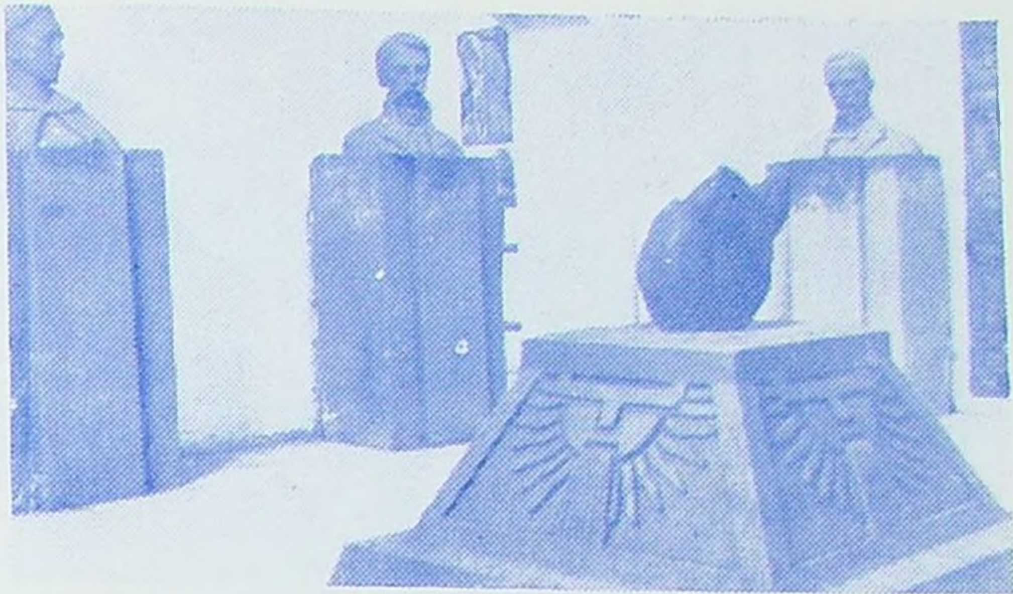
Un ángulo de la Sala Principal de Escultura, con varios bustos de personajes representativos de diversas etapas de la Historia Nacional