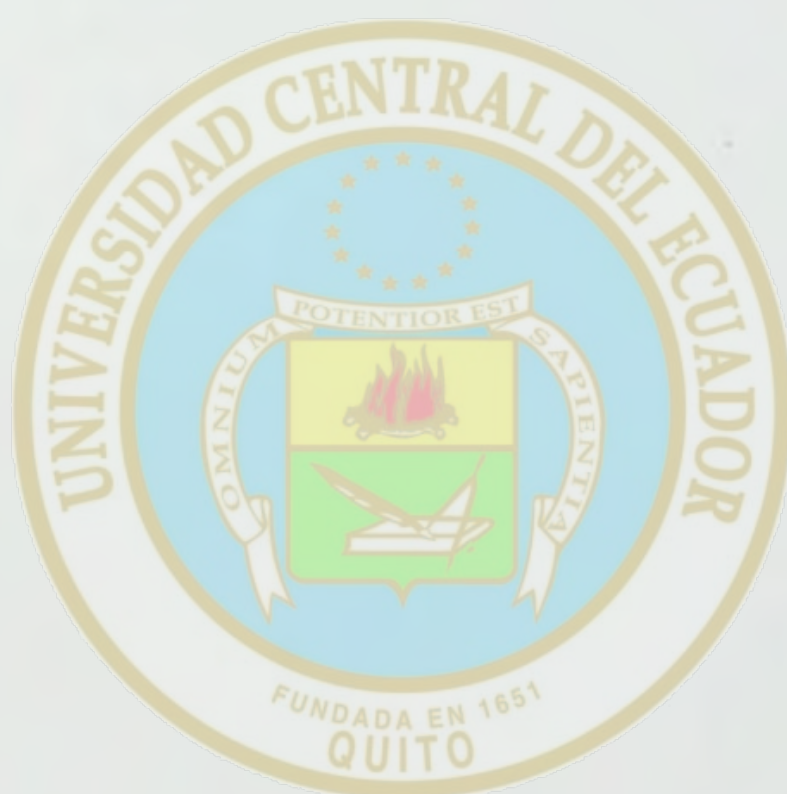
ÁREA HISTÓRICA DEL CENTRO DE INFORMACIÓN INTEGRAL