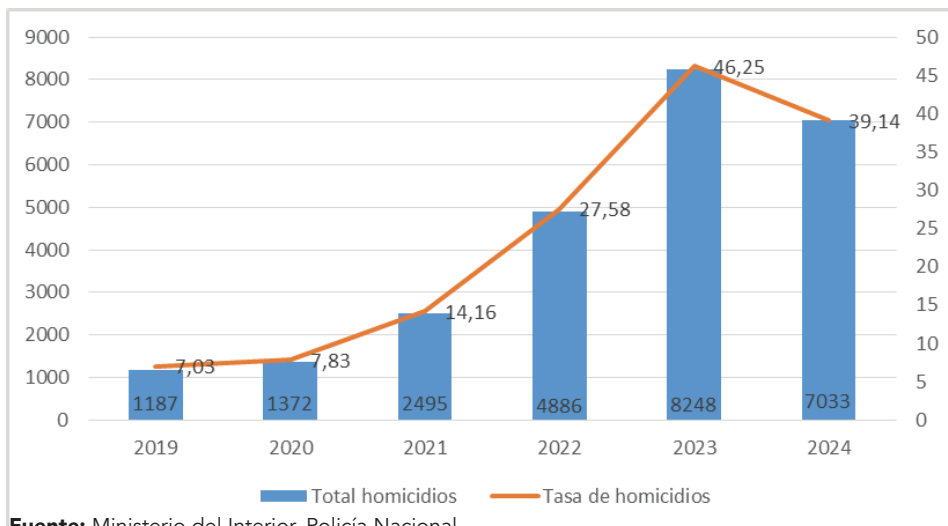
Gráfico 1: Número total de homicidios y tasa anual por 100.000 habitantes