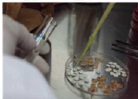
Figura N° 2. Aplicación de extractos en discos

Con pinzas estériles, se colocó discos de papel filtros impregnados con 20 uL de las soluciones a investigar ( Figura N° 2 ) con una pipeta automática, colocando en los sitios ya rotulados.