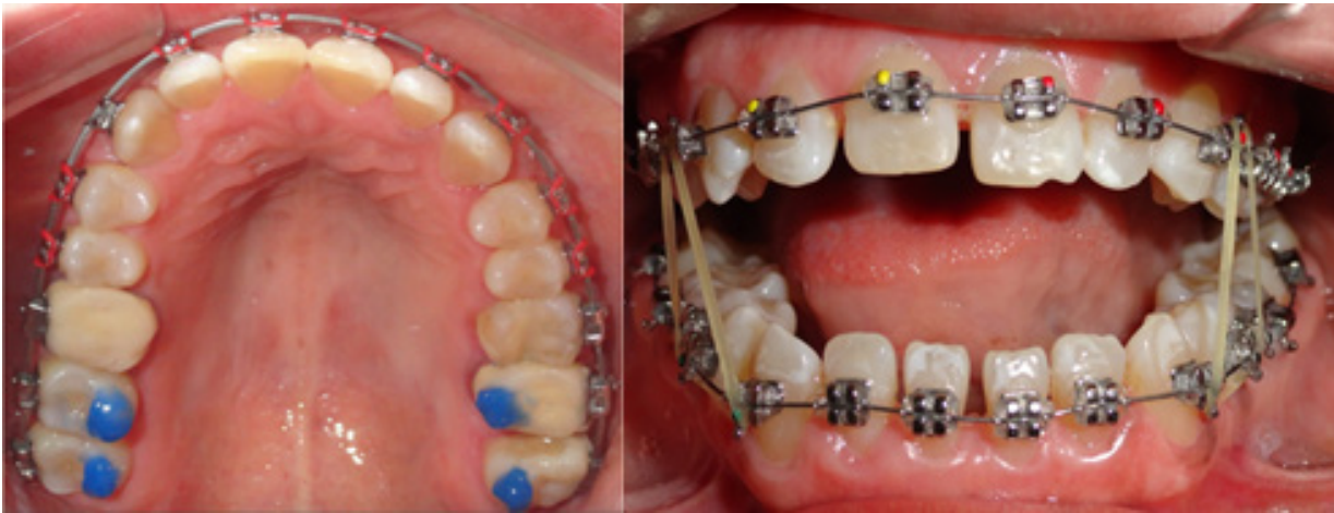
Figura 5. Uso de topes oclusales y de elásticos cortos y ligeros los cuales fueron fundamentales para realizar los objetivos de tratamiento. Use of occlusal stops and short and light elastics, which were essential to achieve the treatment objectives.

"Full bonding" of Roth slot .022 prescription brackets was performed up to upper and lower third molars, placing brackets in centrals at 1.5 mm, laterals at 1 mm and canines at 0.5 mm more towards gingival with respect to the center of the anatomical crown of both arches to achieve extrusion and closure of the open bite and smile arch. The use of posterior occlusal stops and also of short and light anterior elastics (3/16 of 2.5 oz) from the first day of treatment was essential. (Fig. 5)