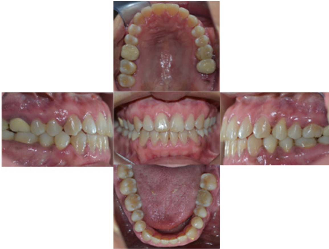
Figura 7. Resultados finales. Final results