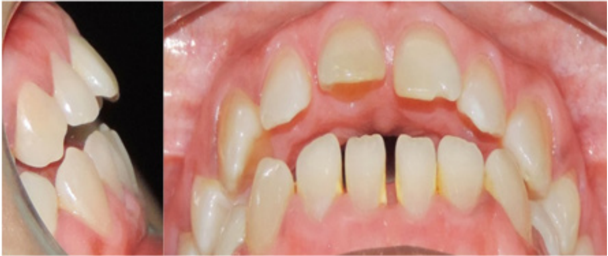
Figura 3. Fotografía de resalte que permite observar un overbite negativo. Highlighting photograph that allows to observe a negative overbite.

En la radiografía panorámica se pudo observar una adecuada longitud radicular y buen estado del ligamento periodontal. En la radiografía lateral de cráneo, mediante trazado de Ricketts se observa una Clase I esquelética, biprotusiva, con mordida abierta anterior, crecimiento vertical. (Fig. 4)