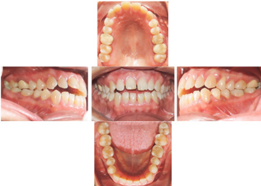
Figura 2. Análisis intraoral; Intraoral analysis.

In the intraoral analysis, the upper and lower midline centered, anterior open bite, adequate labial frenulum insertion was observed. Bilateral molar class I and bilateral Canine II class, 0,5 mm Spee curve and gingival recessions in dental organs 33 and 43. The upper and lower U-shaped arch, diastemas, presence of third molars and crowns in dental organs 16 and 26 (Fig. 2)